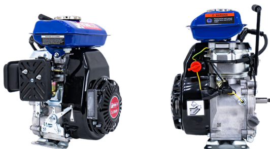
MOTOR DE 3.5HP